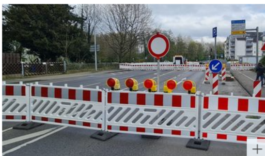
Zu- und Ausfahrt zur Pommernstraße ist gesperrt.

Der Kreisverkehr Rennbaumstraße wird zweispurig ausgebaut. Die Umbau- und Sanierungsmaßnahmen sind seit Frühjahr 2023 in Gang und sollen bis Frühjahr 2023 abgeschlossen sein.